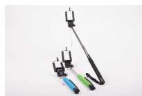
Perche pour autos-portraits

COMMANDEZ 2 MALLETES ET RECEVEZ UN DE CES CADEAUX À VOTRE CHOIX