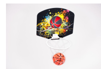
Mini panier de basketball